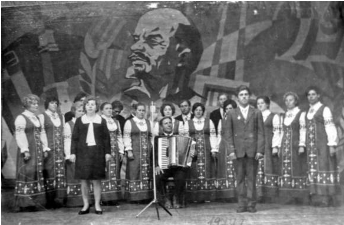
Концерт художественной самодеятельности , 1974 г.