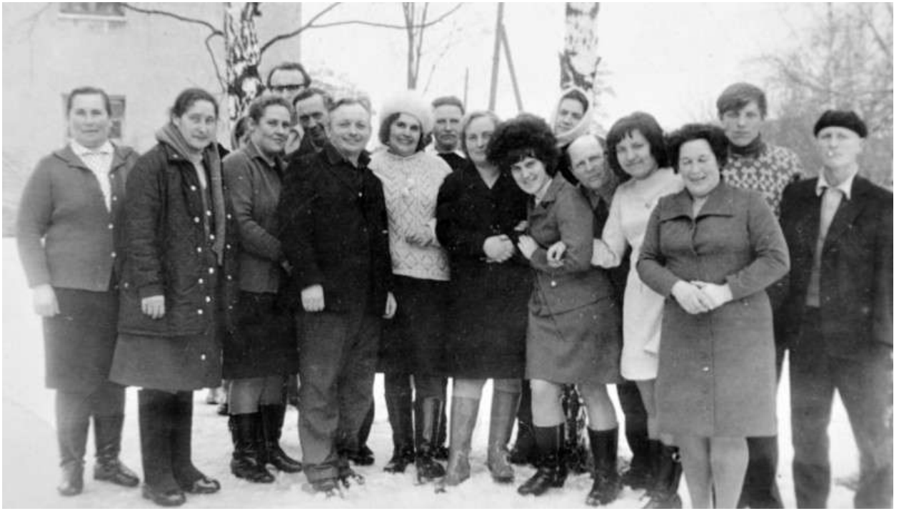
И на морозе жарко.