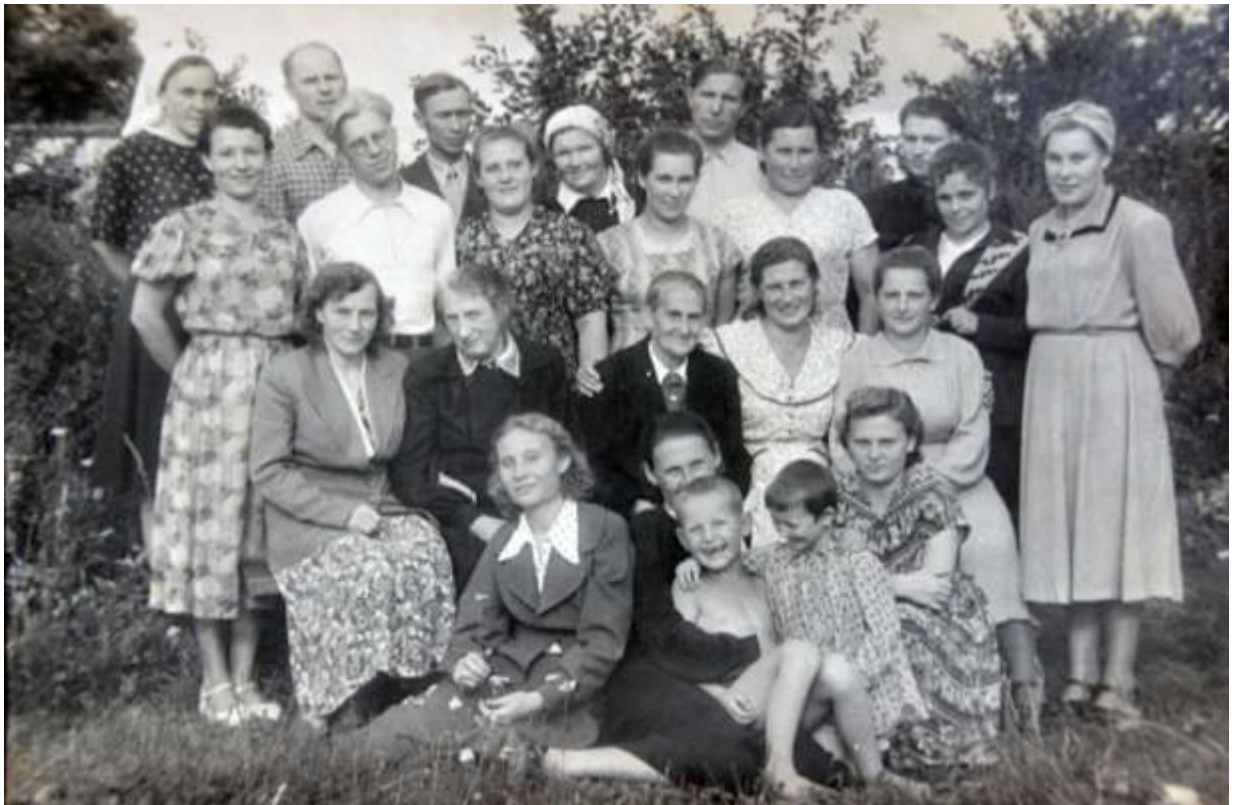
Первосентябрьский сбор коллектива