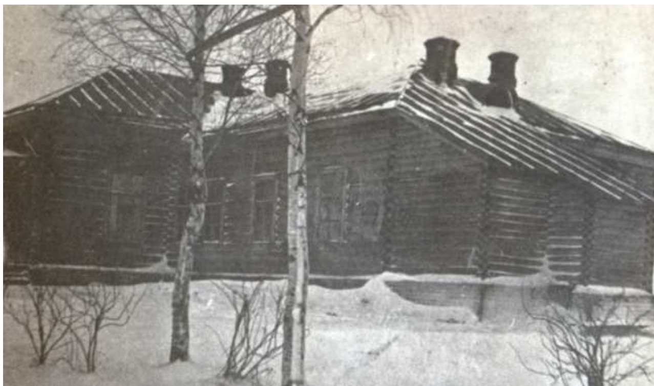
Первое здание школы, 1896 г.