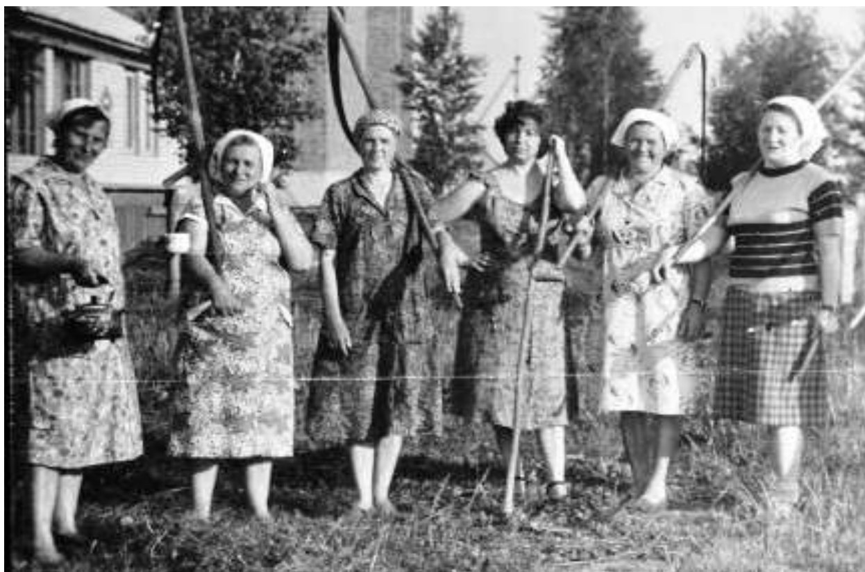
Вот на ком земля коробецкая держалась...