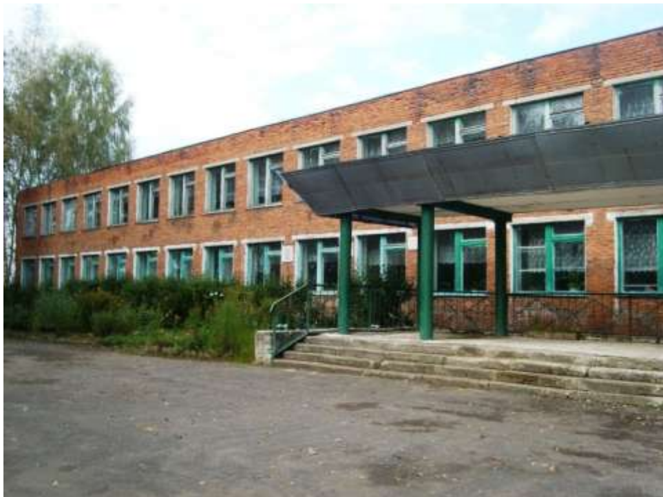
Современное здание Коробецкой средней школы