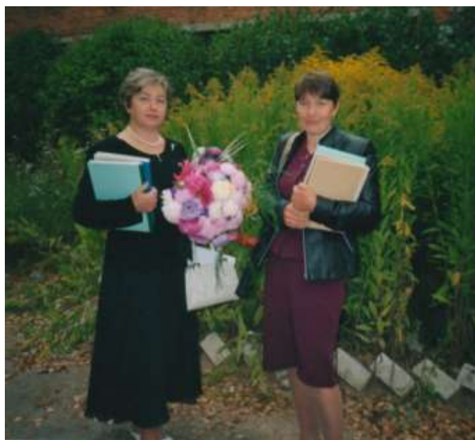
Сентябрьские астры, 2005 г.