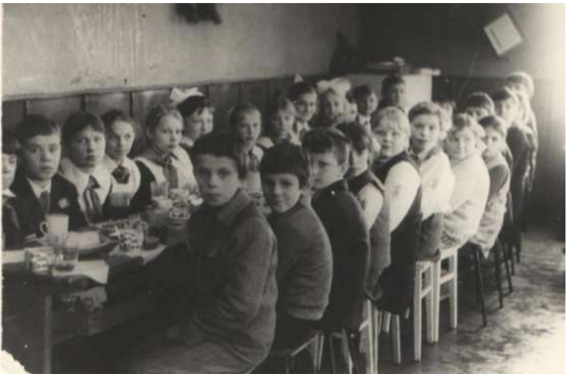
Классное во всех смыслах чаепитие