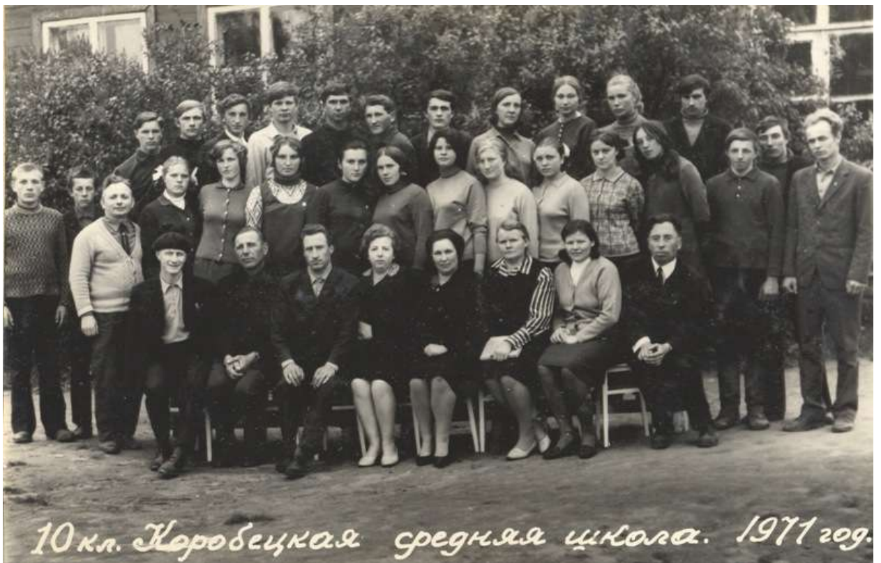
Традиционная фотография при окончании школы, 1971 г.

С 15 августа 1960 года он начал свою трудовую деятельность в Коробецкой средней школе учителем русского языка и литературы, где проработал практически всю жизнь. Его педагогический стаж составил 34 года и 15 дней.