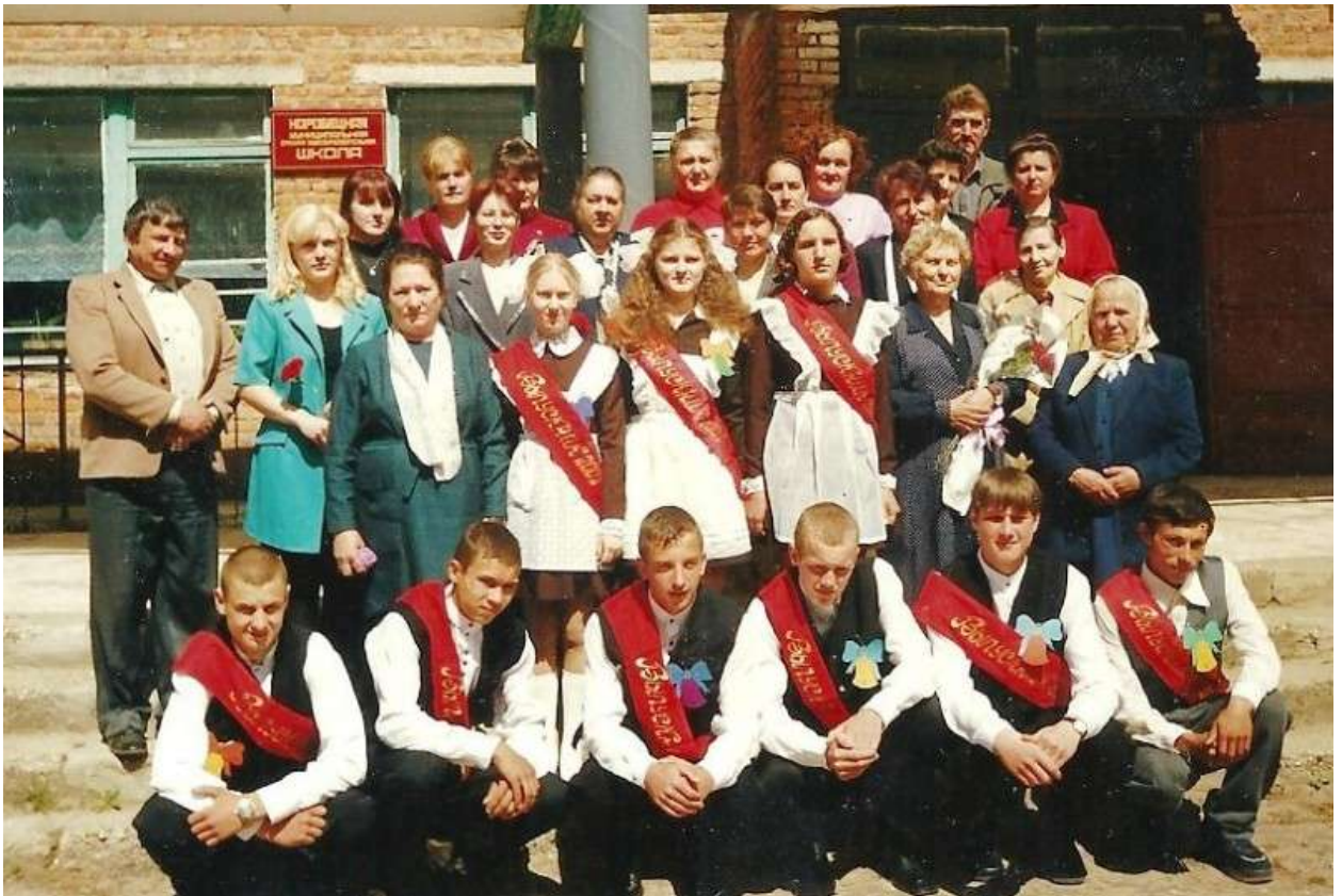
Выпуск 2001 года