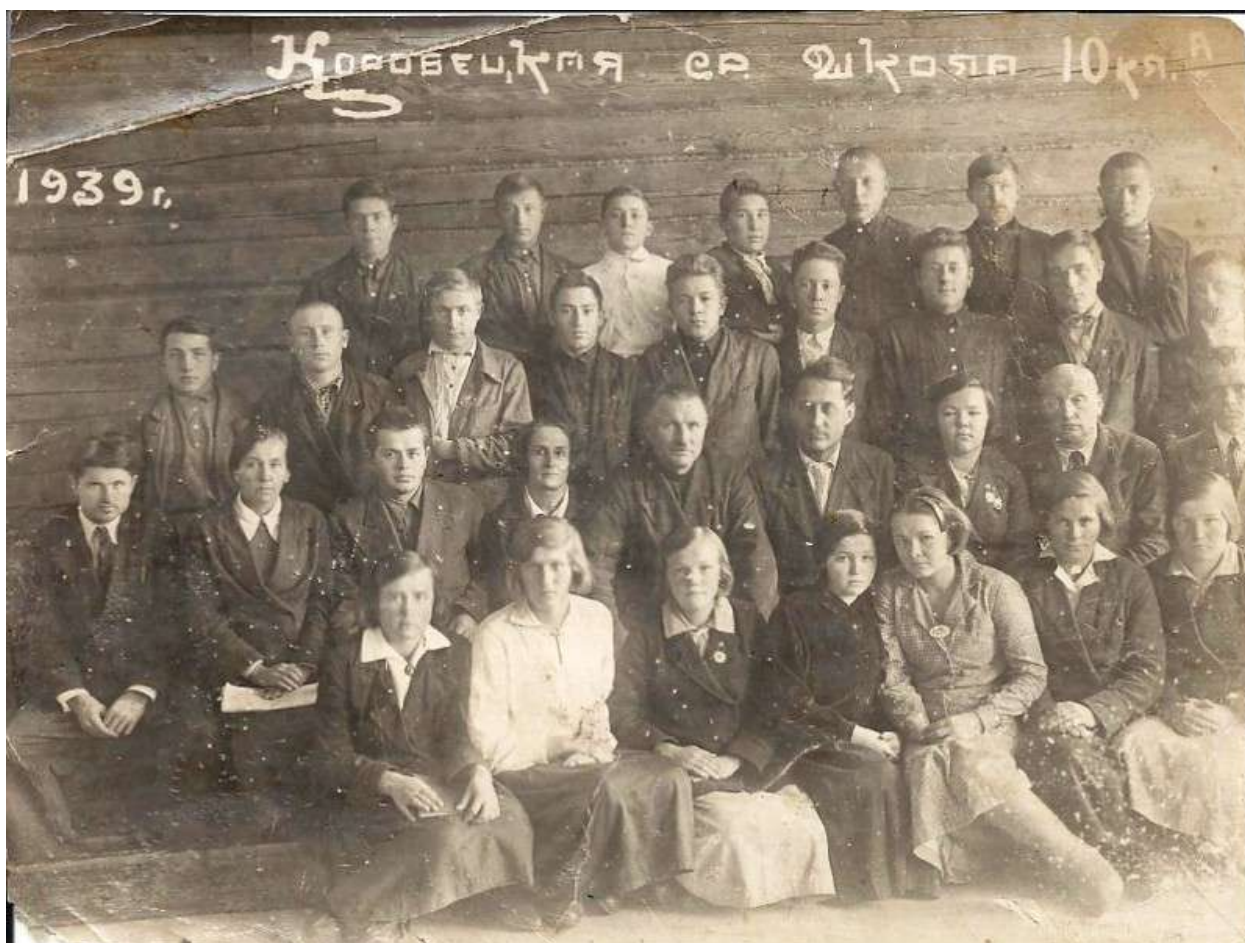
Выпускники 1939 г.