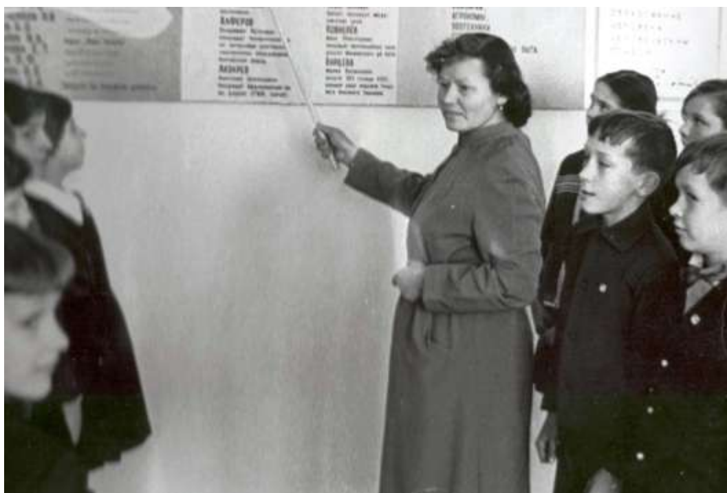
В школьном музее