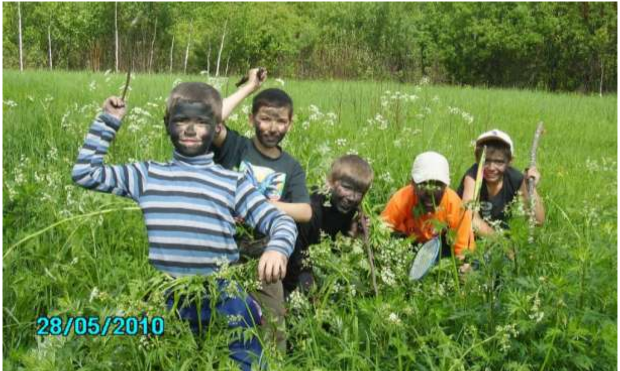
Пятеро из табакерки!