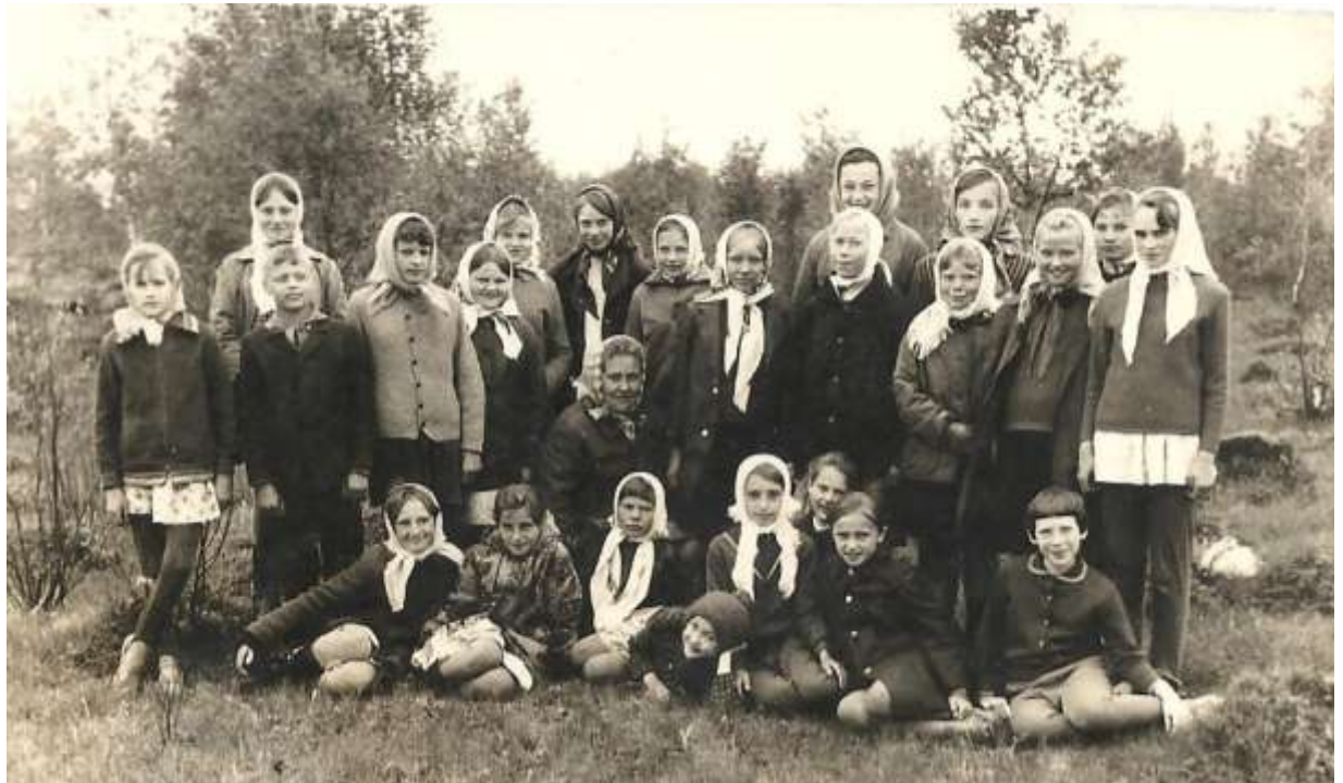
Знакомство с родным краем