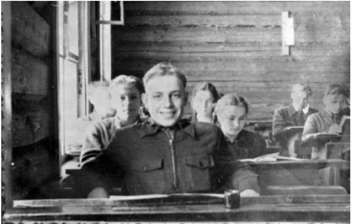
Такая вот оптимистичная личность