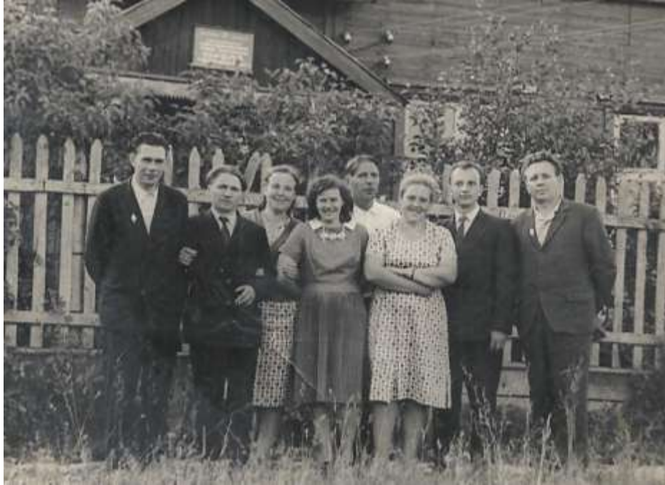
Как молоды мы были..., 1961 г.