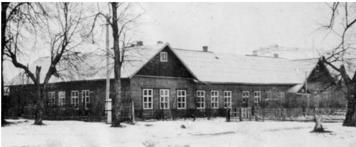
Послевоенное здание Коробецкой средней школы

получать. Я поставила себе планку высоко: только хорошие и отличные оценки.