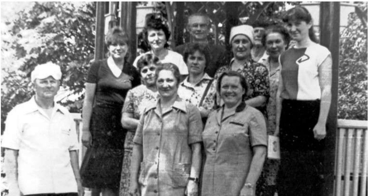
В Новоспасском с коллегами