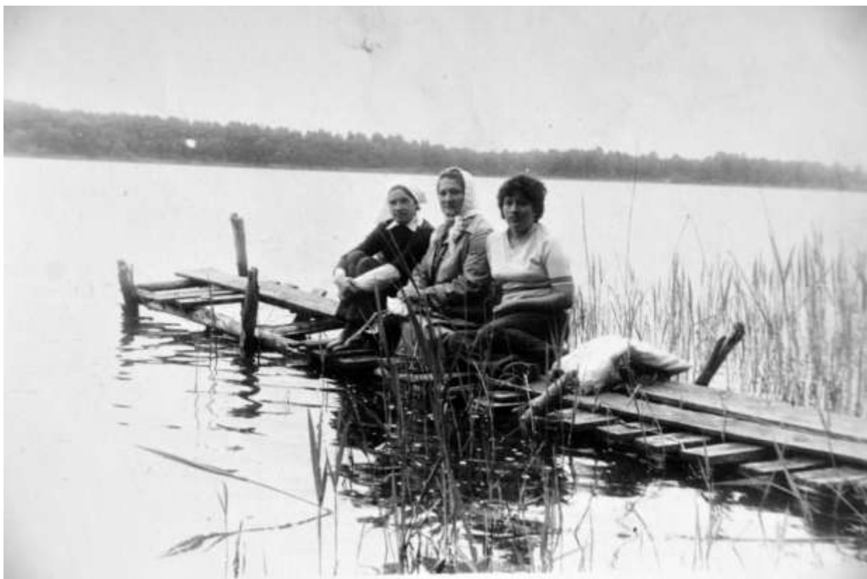
До чего же хорошо кругом!