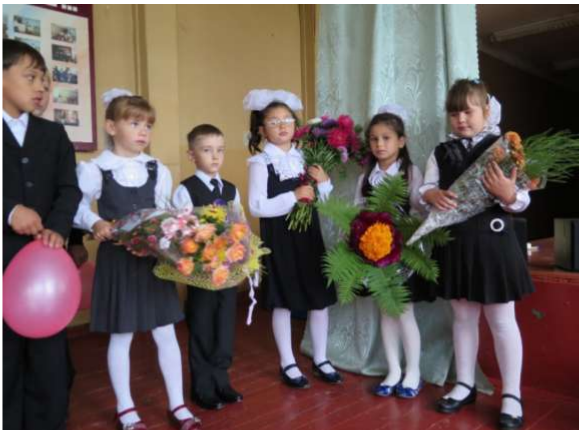
Ну, очень серьёзные дети...