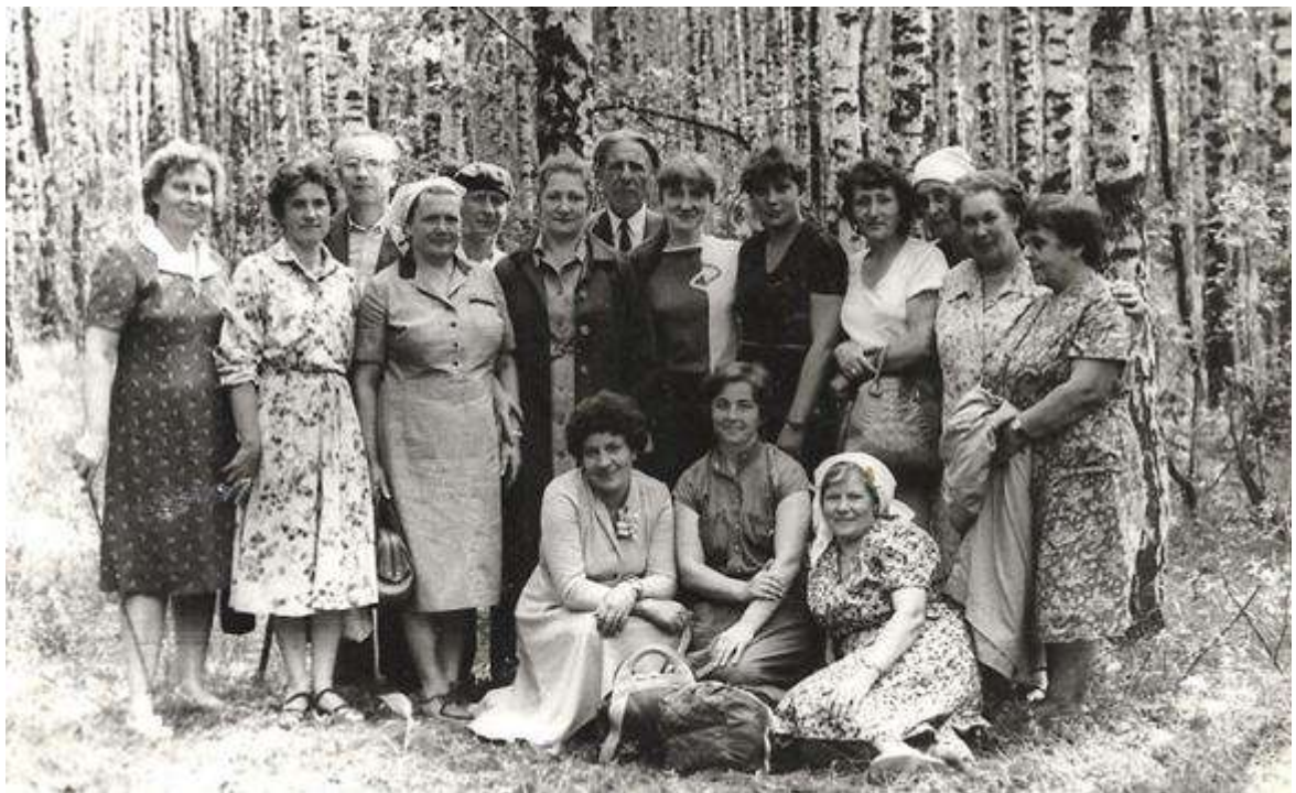
Отдых в Казаринке во время похода в Новоспасское, 1986 г.