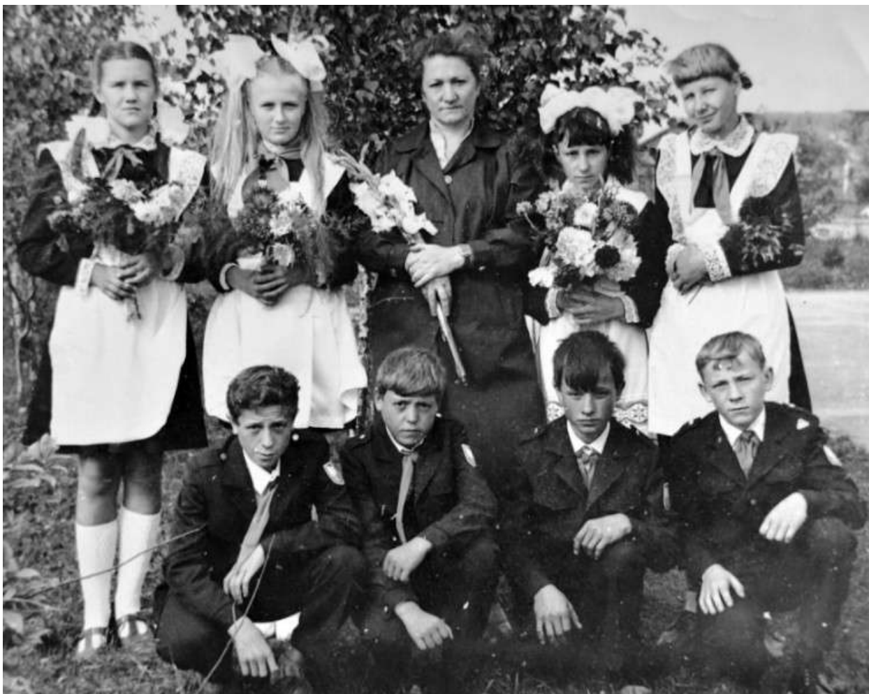
Девочки в белых фартучках, парни в униформе – замечательно

По итогам аттестации присвоено звание «Учитель-методист», награждена значками «Отличник просвещения СССР» и «Отличник народного просвещения», медалями «За доблестный труд» и «Ветеран труда», имеет несколько знаков «Победитель социалистического соревнования от имени Министерства и профсоюза работников просвещения высшей школы и научных учреждений РСФСР, множеством грамот за достигнутые успехи и плодотворную работу по обучению и воспитанию подрастающего поколения, активную общественную работу среди населения, занесена в районную книгу почета.