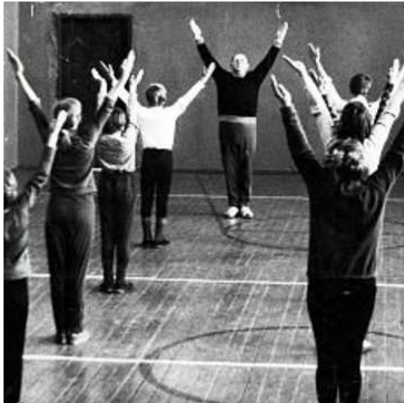
Урок физической культуры

солистом и участником хора, который в праздники выступал перед сельчанами в местном Доме культуры.