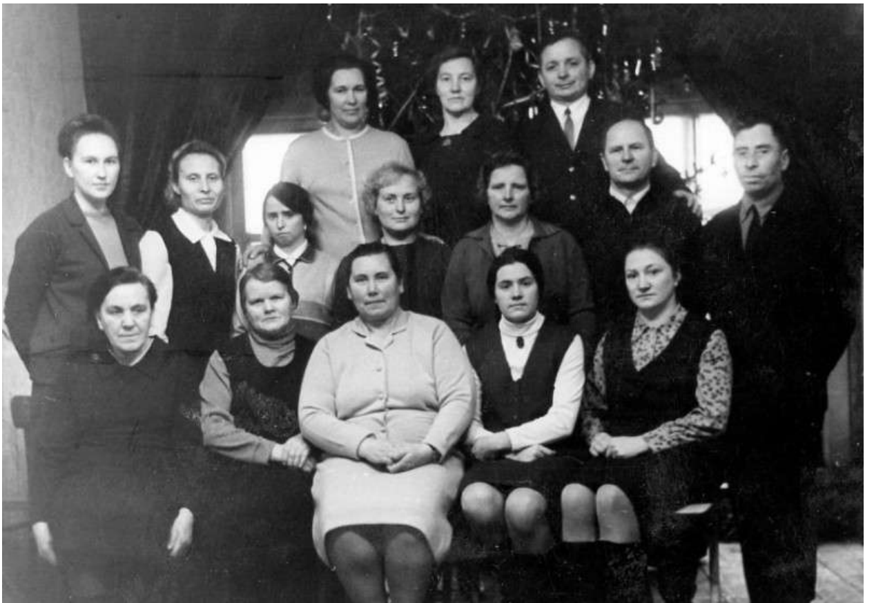
Новый год, это очевидно...