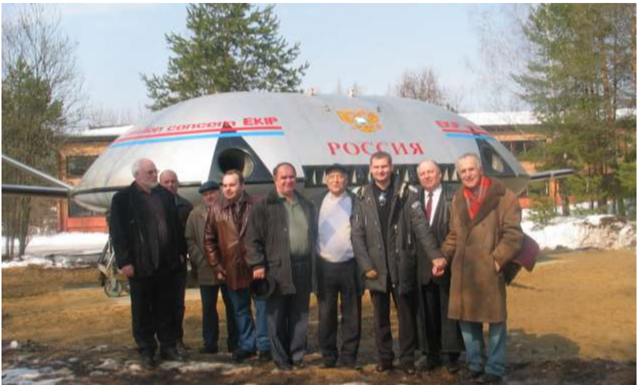
Безаэродромный амфибийный летательный аппарат НПФ «ЭКИП» массой 40 т в музее «Боевое братство».

Энергоблок АЭС электрической мощностью 1000 МВт своим бросовым теплом может отапливать теплицу площадью не менее 800 га. Сбыт готовой продукции в города Смоленск (расстояние 120 км), Калугу (170 км), Брянск (250 км), Москву (270 – 330 км). Расстояния за пределы Смоленской области указаны с учетом постройки 5 км дороги через реку Грохот. Отходы зелёной массы утилизируются в биореакторах с получением биодобавок, витаминов и биологически активных удобрений. Получаемый биогаз используется на привод тепловых насосов, а выбрасываемый углекислый газ подаётся в теплицы на фотосинтез. В ночное время теплицы освещаются электроэнергией от АЭС по минимальным тарифам.