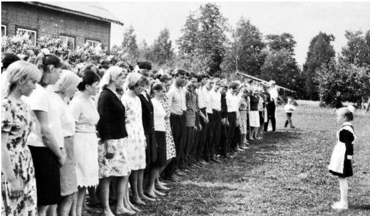
Последний звонок нашему выпуску, 1967 год.

закладывали в нас основы нашей русской ментальности, морали, любви к Родине.