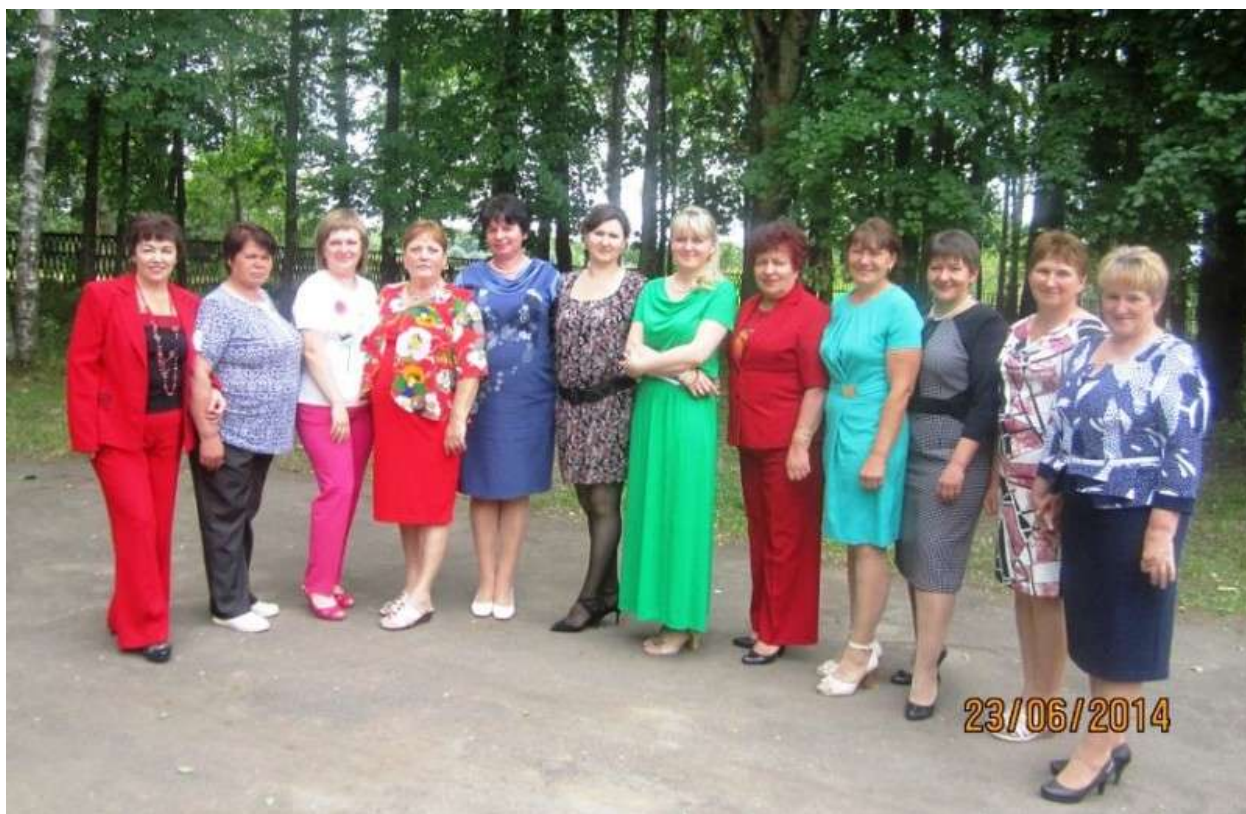
Педагогический коллектив школы, 2014 год