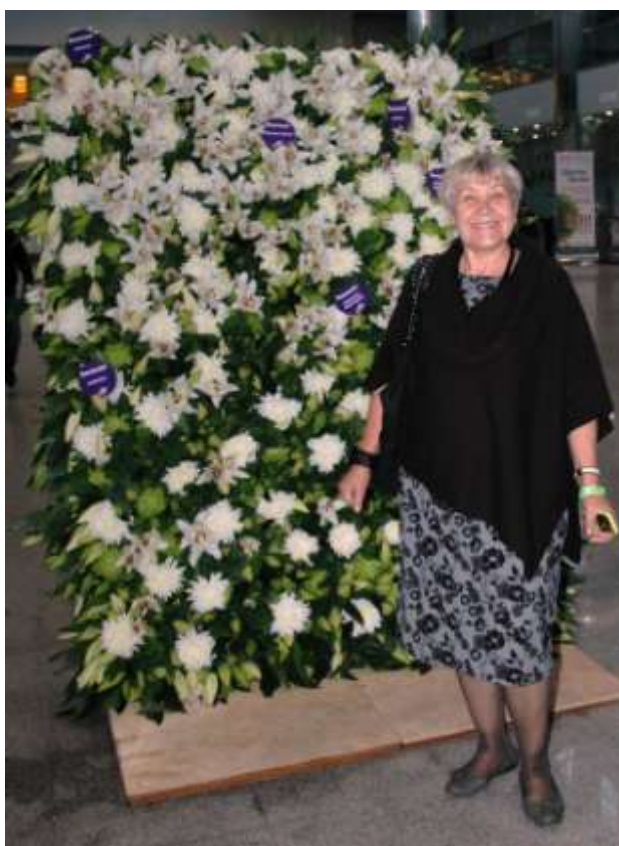
На выставке цветов в Крокус-Сити в Москве, 2015 год

делегатом на первый и единственный Слёт студентов СССР в Москве в 1971 году, где нас приветствовал руководитель КПСС Леонид Ильич Брежнев, где каждому из нас вручили медали «За доблестный труд». Три года руководила комсомольской организацией факультета, а главное, в конце учёбы в руках у меня была замечательная специальность. То ли время было такое созидательное, то ли стремление к знаниям, интерес к будущей работе были всепоглощающими, студенческие годы пролетели как один миг.