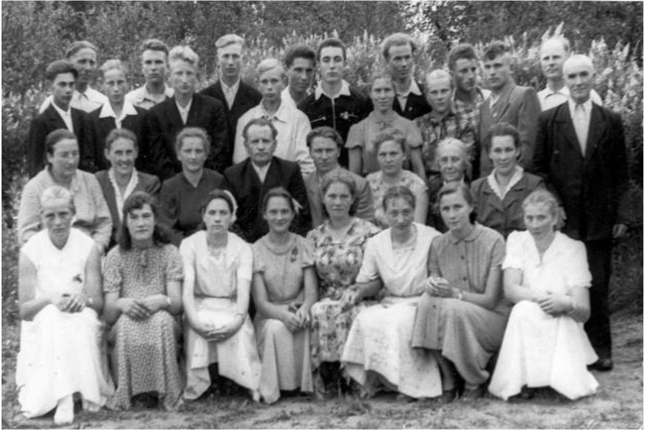
Выпуск 1960 года

комбайнёра и к 9 классу самостоятельно уже мог работать на этой технике.