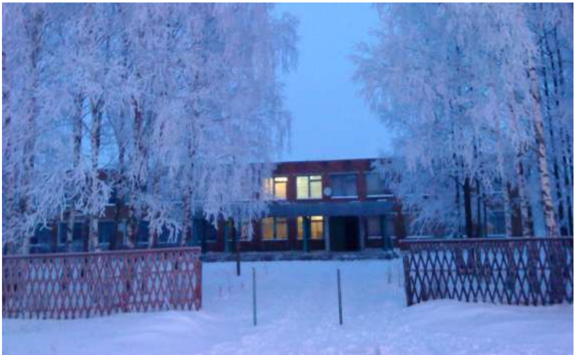
Родная школа зимой

Было бы гораздо информативнее, если бы выкладывая фотографии в Интернет, авторы сопровождали их комментариями: кто, где, когда...- Прим. ред.