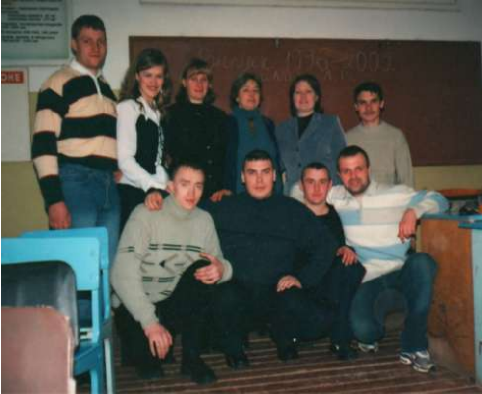
Встреча с моими выпускниками, 1996 г.

Считаю, что мне повезло, что я всю свою жизнь прожила на родине и работала в родной школе, и не пришлось бороться с ветряными мельницами на стороне. Куда бы ни занесло моих одноклассников, всё-таки они стремятся приехать в Коробец, увидеться с оставшимися друзьями и подышать воздухом родины. И мои ученики знают, где им искать их бывшую учительницу. Я посвятила свою жизнь одной из самых нужных человечеству профессий, об этом я мечтала в детстве, и это исполнилось. И я в отличие от большинства своих ровесников имею ещё и бонусы – благодарности от многих своих учеников.