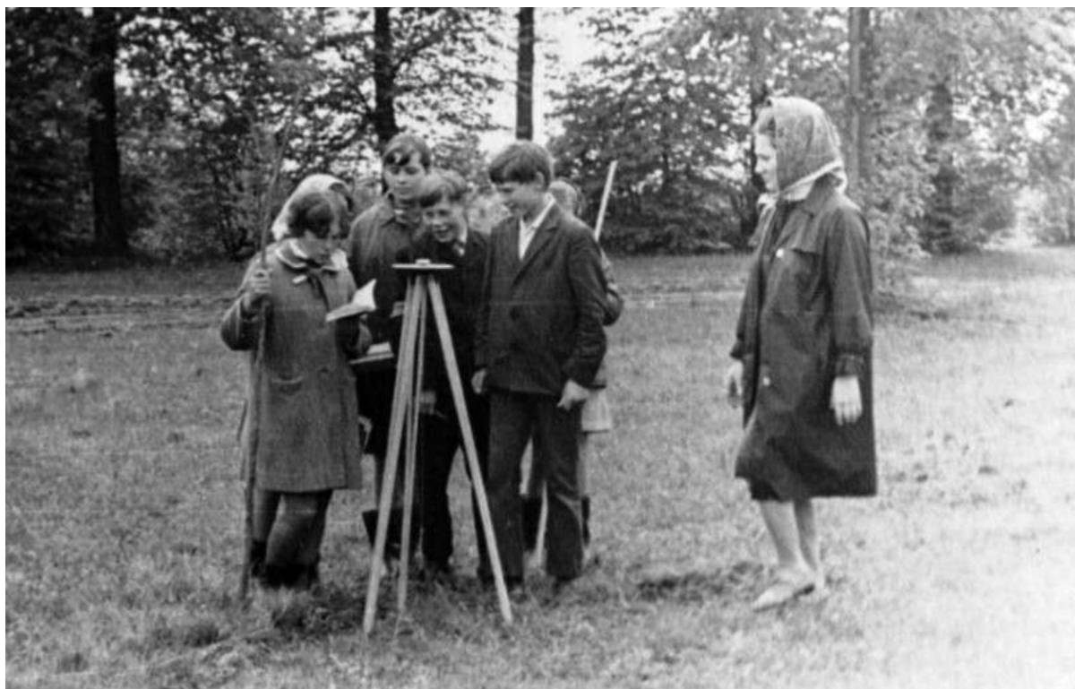
Работа на местности