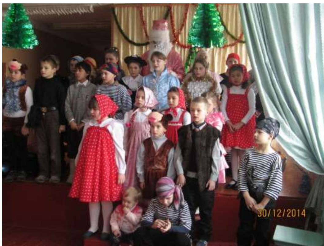
В ожидании чуда, 2014 г.