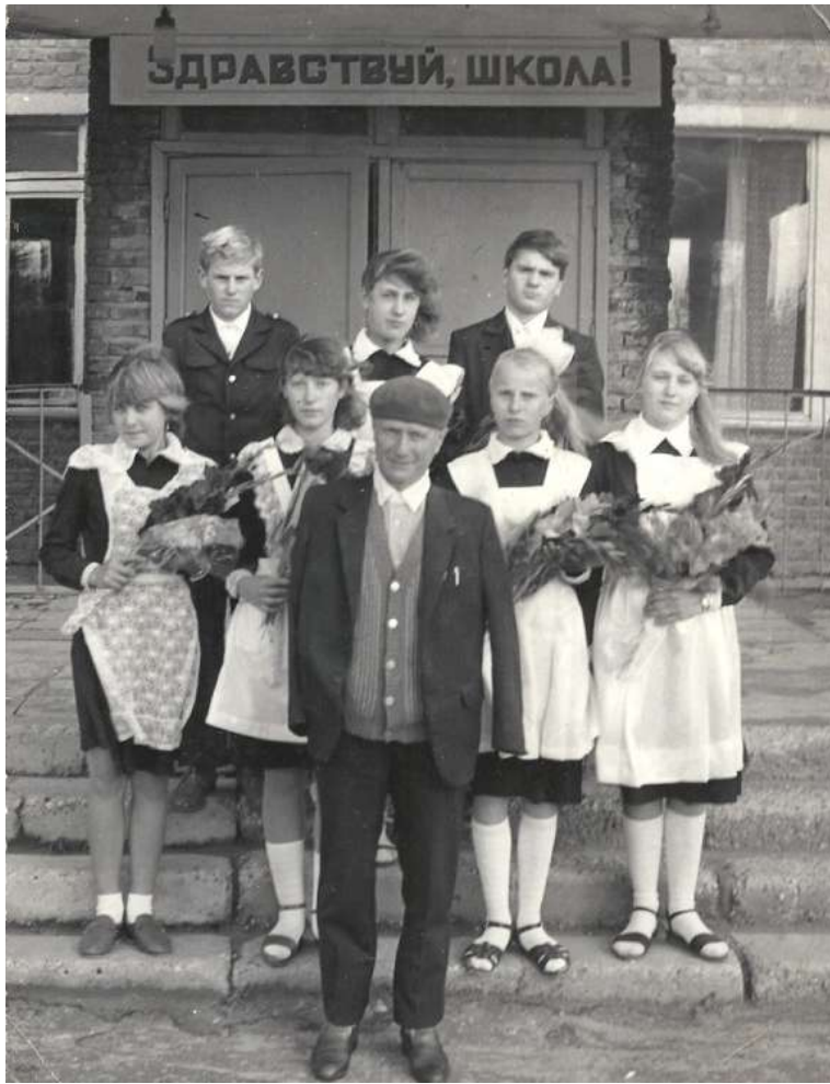
Умный класс: учителю – достойное место на фото, 1986 г.