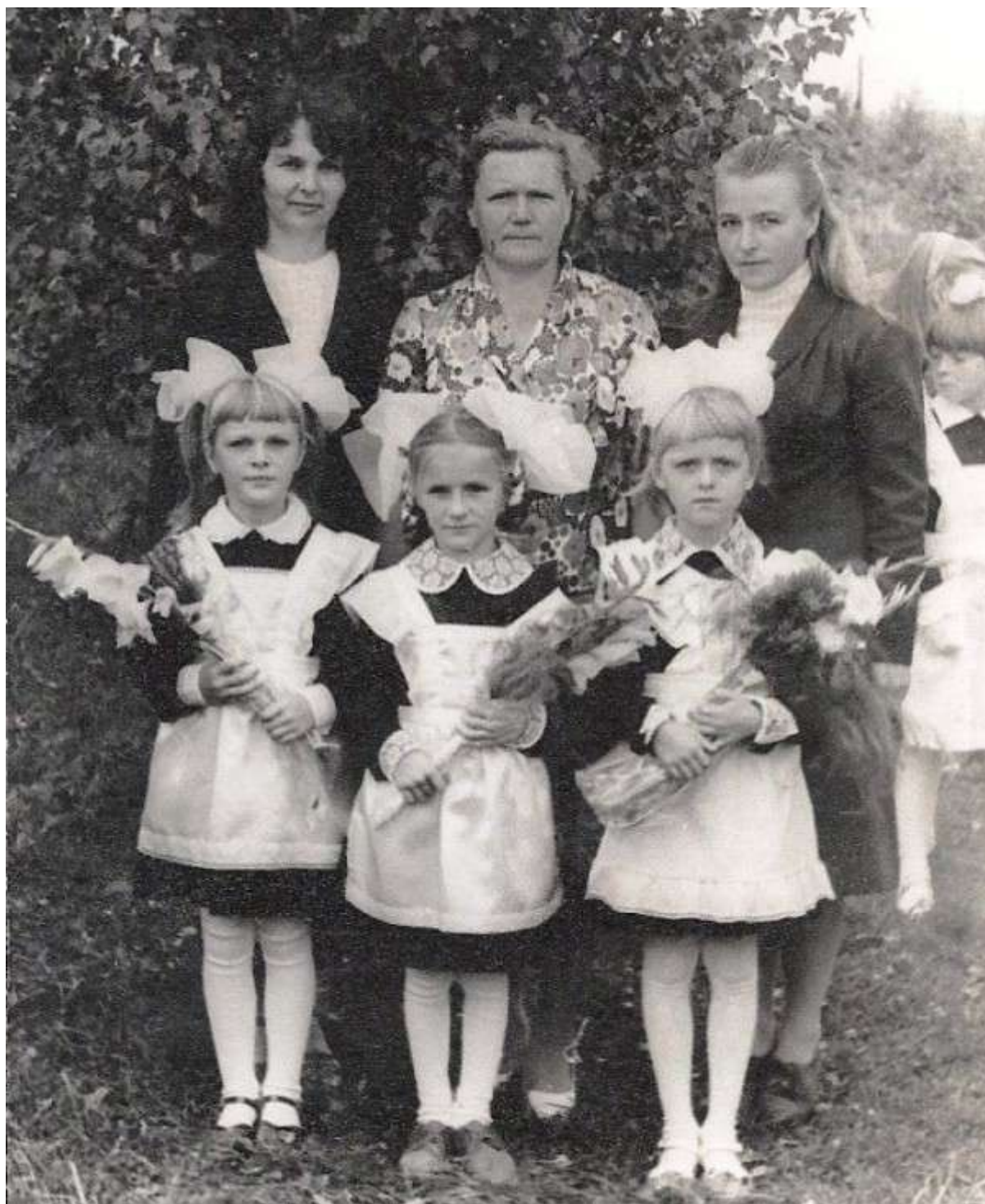
1 сентября – День знаний, 1984