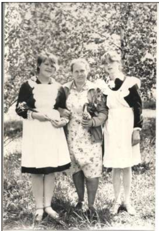
В саду с выпускницами