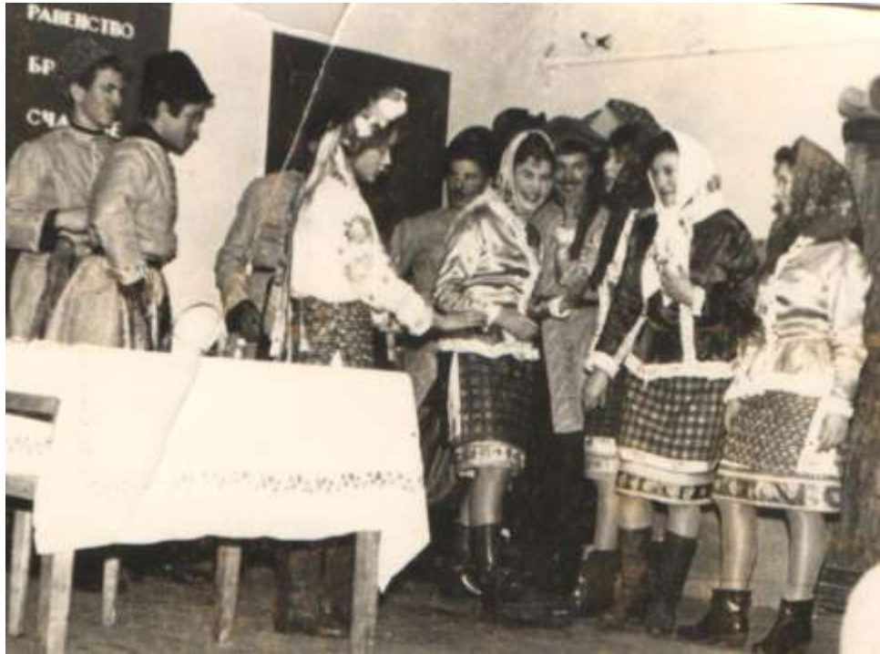
Сцена из спектакля «Ночь перед Рождеством, 1965 г.

Как прошёл концерт?» Так могли нас встречать ещё только родители.