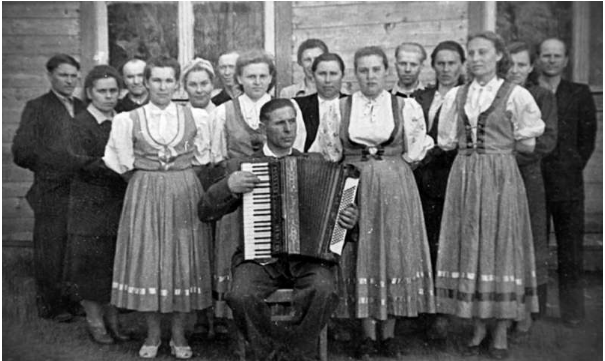
«Какая ж песня без баяна?..»

правильно обращаться со всеми этими опасными предметами. Видимо он понимал, что запретить нам всё равно не удастся, так