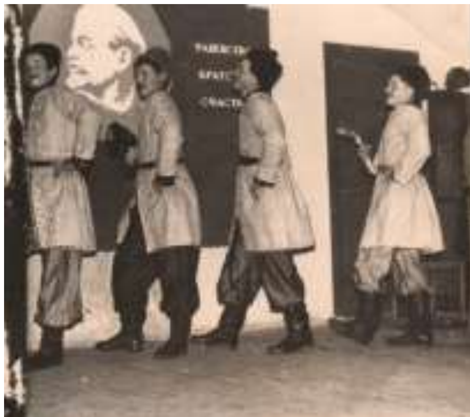
«Ночь перед Рождеством», парубки из 10-б, 1965 г.