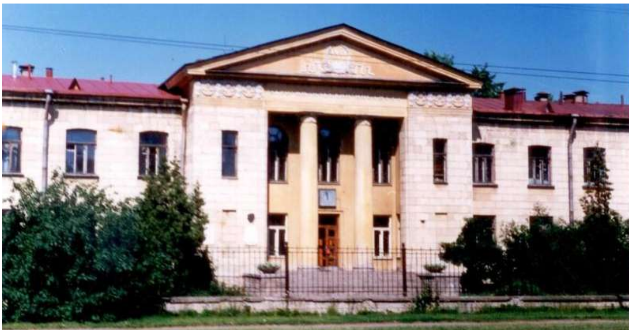
Здание Агрофизического научно-исследовательского института, г. Санкт-Петербург, Гражданский пр.,14

Почти всю свою жизнь я занимался служению науке, этой капризной, но такой притягательной даме. Н.Г.Чернышевский в своё время сказал: «Чем больше знакомишься с наукой, тем больше