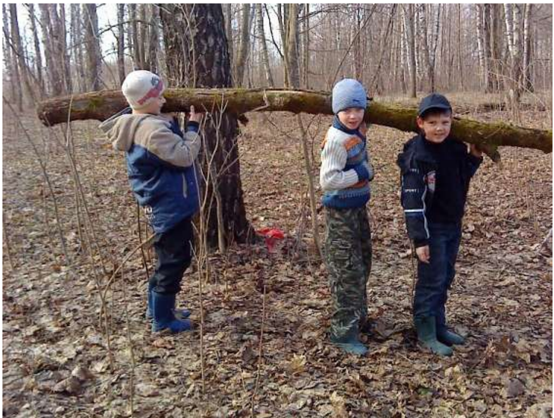
Молодцы, ребята! Три богатыря