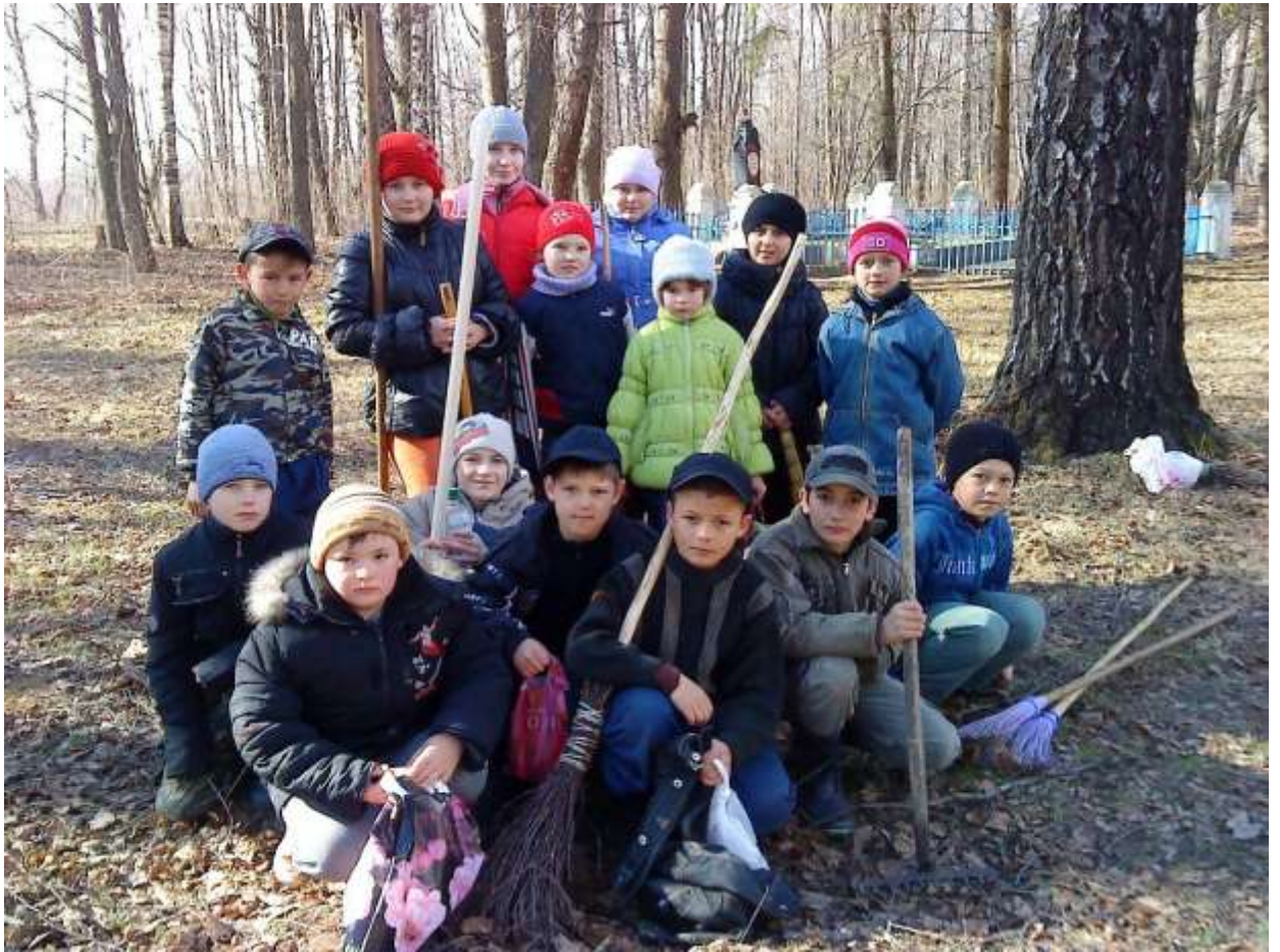
За такую смену не страшно