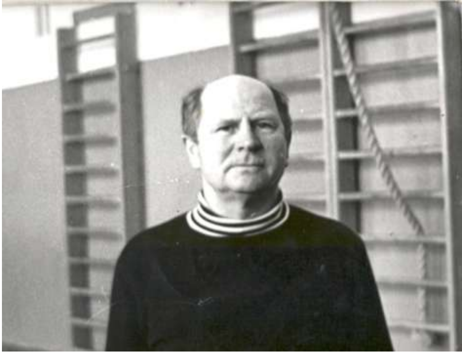
Папа в спортзале нового здания школы, 1974 г.