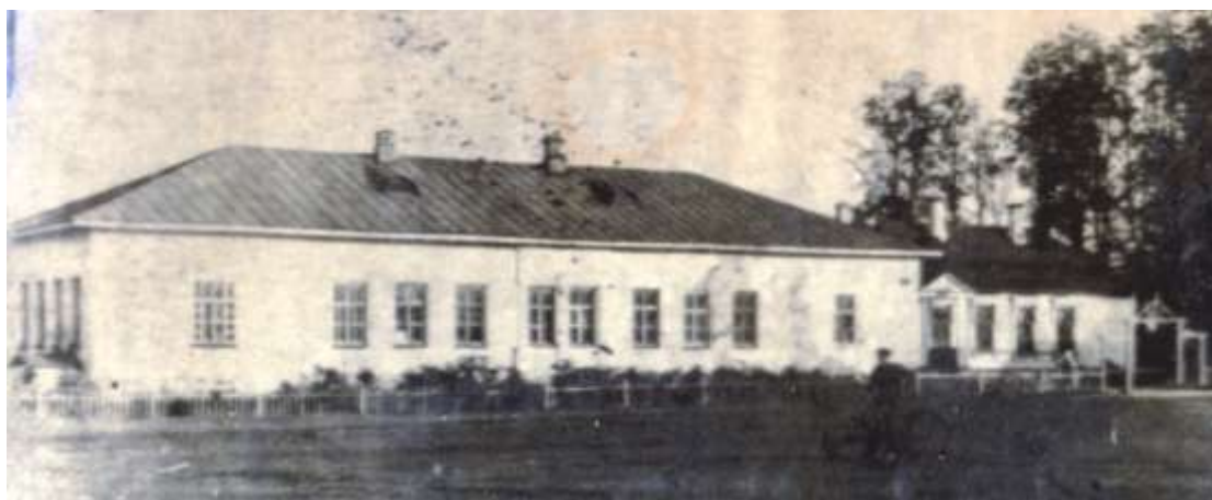
Второе здание школы, расположившееся в бывшем помещичьем доме, 1925 год