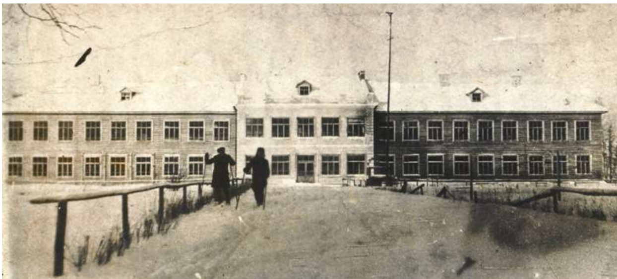
Довоенное двухэтажное здание школы, 1939 г.