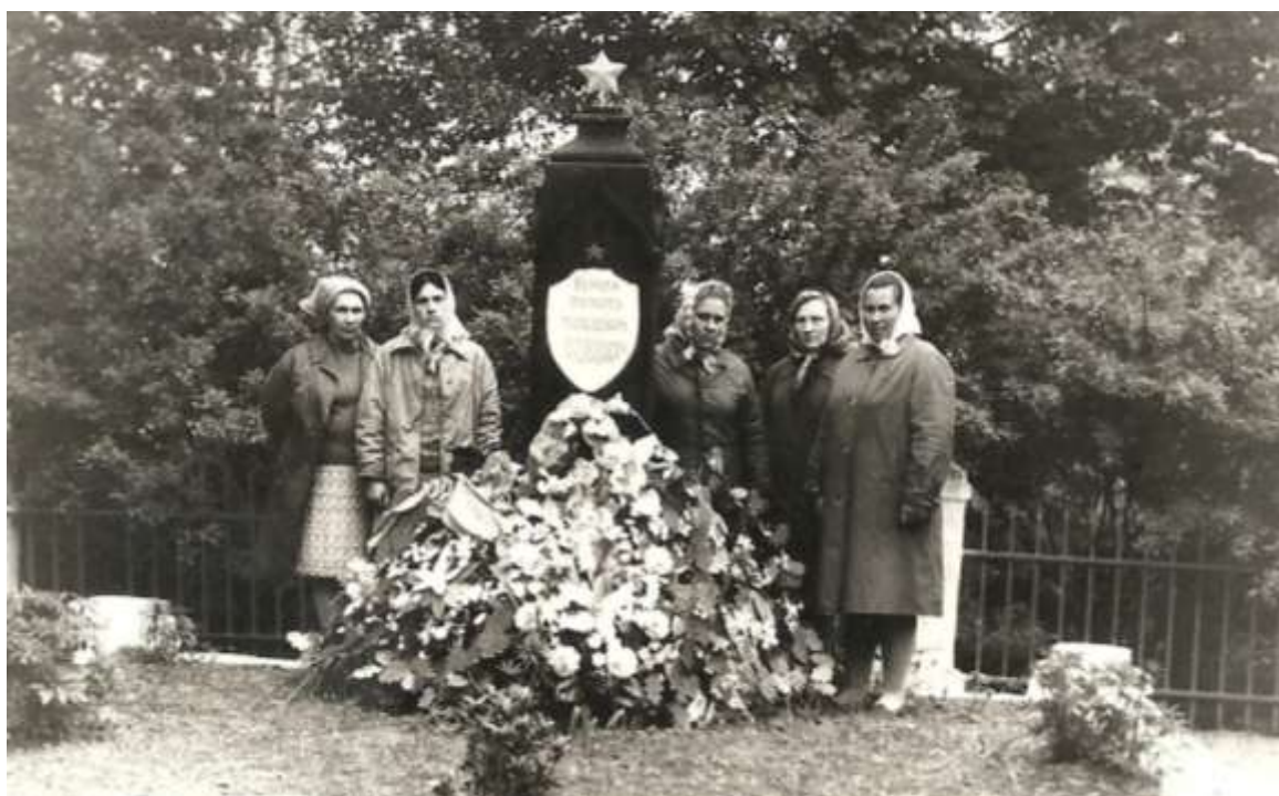
Коробецкие учителя - постоянные хранители могилы