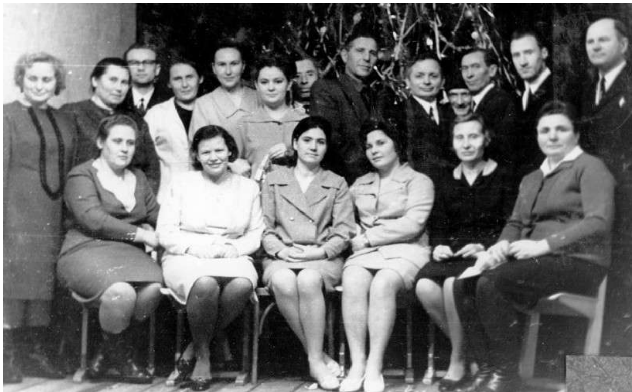
Учительский коллектив Коробецкой средней школы, 1960-е

мне их хватит. Позволяла только одну «подушечку» на кружку чая. Каждый день ходила на лекции и в читальный зал впроголодь.