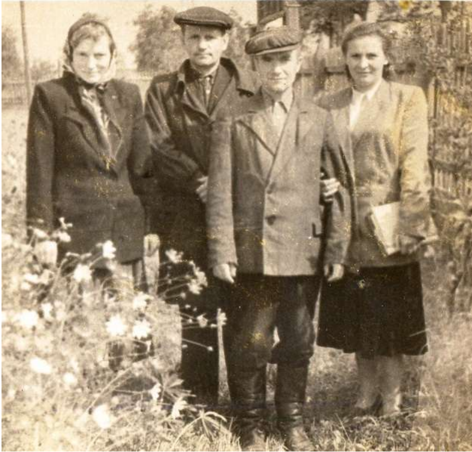
Дорогие сердцу фотографии молодых коробецких учителей.