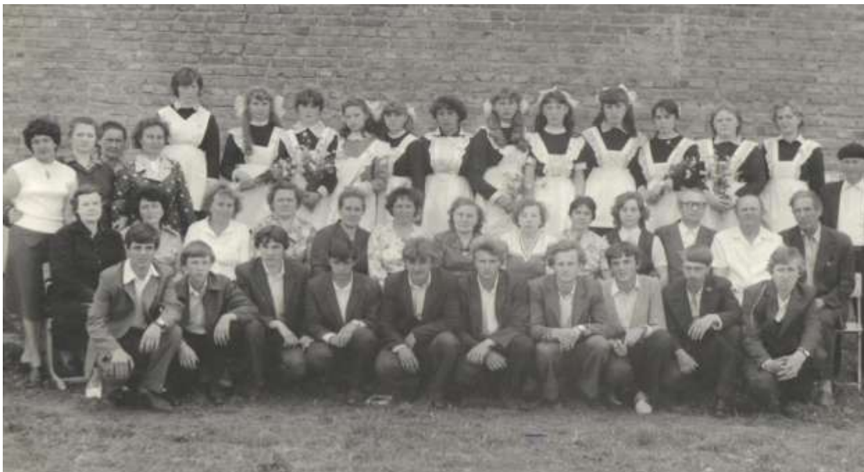
Мой первый выпуск, 1984 г.

Я отработала в КСШ 36 лет. Что и говорить, были и трудности, были и победы. Поменялись времена. В новом времени,