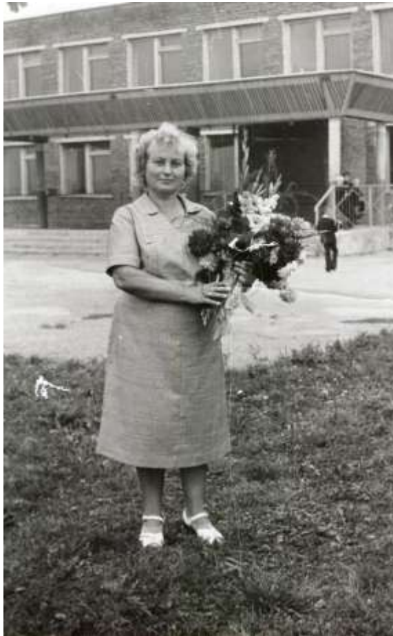
На фоне родной школы